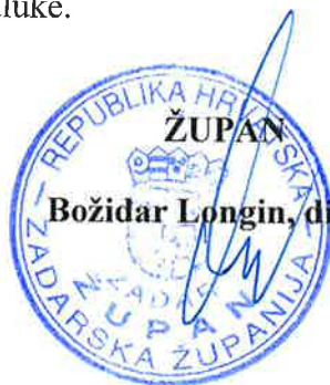
Božidar Longin, dipl. ing.

Slijedom navedenog, odlučeno je kao u izreci ove Odluke.